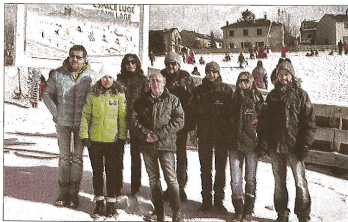
► La photo de famille lors de l'audit de février dernier.

Techniquement, le label Famille plus est accordé pour une période de trois ans aux communes qui mènent une réelle politique d'accueil des familles et des enfants. Il est accordé sur dossier de candidature et un audit de contrôle permet de s'assurer que les critères, nombreux, sont bien respectés. Des contrôles intermédiaires et un travail régulier permet également une amélioration et une adaptation constante de l'accueil et de l'offre destinée aux familles. Les professionnels d'hébergement, d'activités et de restauration s'engagent aux côtés des