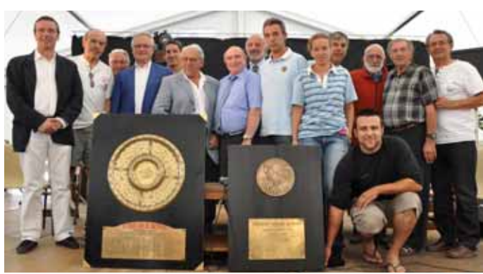
Les deux planxots