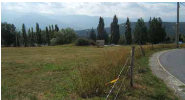
Entre Font-Romeu et Odeillo, sous le lotissement du Serpolet, le site du futur groupe scolaire