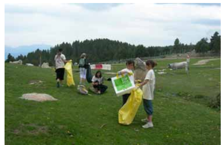
Le ramassage des déchets aux abords du Parking des Airelles

Une nouvelle opération Montagne Propre aura lieu au printemps 2010, et pour cette seconde édition, un appel à toutes les bonnes volontés sera lancé pour venir en aide aux petites mains du collège. Vous pouvez dès à présent manifester votre envie de participer en vous inscrivant à la Mairie ou par courriel ( carole.rinjonneau@mairie-fontromeu.fr ou daniel.gauthier@mairie-fontromeu.fr ). Si le nombre de participants est suffisamment important, il pourra être possible d'étendre cette opération à un troisième site qui en aurait également besoin : le parking du Col del Pam, voire le long de la route qui monte à la station.