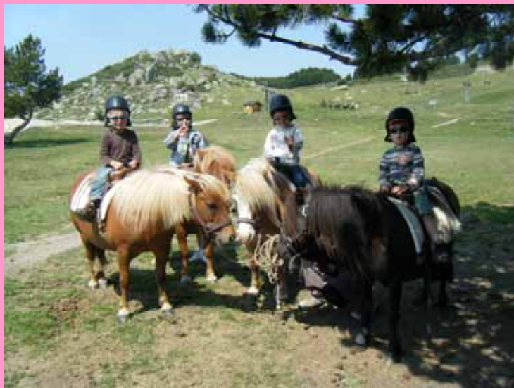
Promenade à poney aux Airelles

Les vacances sont terminées, et vivement les prochaines pour d'autres aventures!