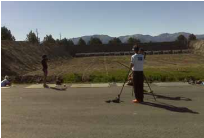
L'équipe de France de biathlon en entraînement au nouveau pas de tir

C'est bien d'idées nouvelles pour développer ensemble le territoire dont nous avons besoin, et non d'un