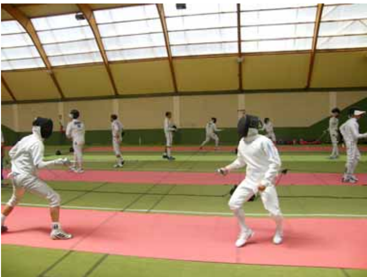
Equipe britannique de pentathlon sur les terrains de l'ESCB

L'accueil de sportifs en stage est désormais organisé. Nous avons ainsi accueilli les équipes britanniques de fond, demi-fond et de pentathlon, et au mois d'août, le club de volley de Narbonne. Le développement de ce type de stages, grâce à nos installations sportives, est à l'étude, et c'est pourquoi nous réfléchissons à transformer une partie de l'ESCB en véritable centre de préparation physique moderne, muni de tous les équipements de récupération nécessaires. Ce programme devra bien sûr s'inscrire rapidement, en vue de la préparation des jeux de Londres en 2012, et ces nouvelles infrastructures seront également accessibles à