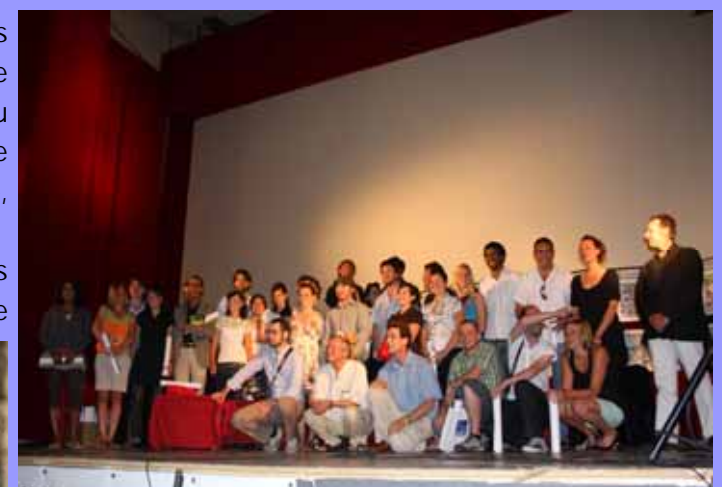
L'ensemble des jeunes architectes lors de la cérémonie de clôture du forum