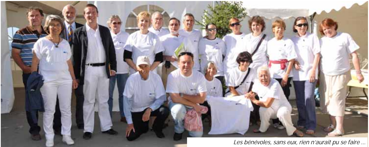
Les bénévoles, sans eux, rien n'aurait pu se faire ...