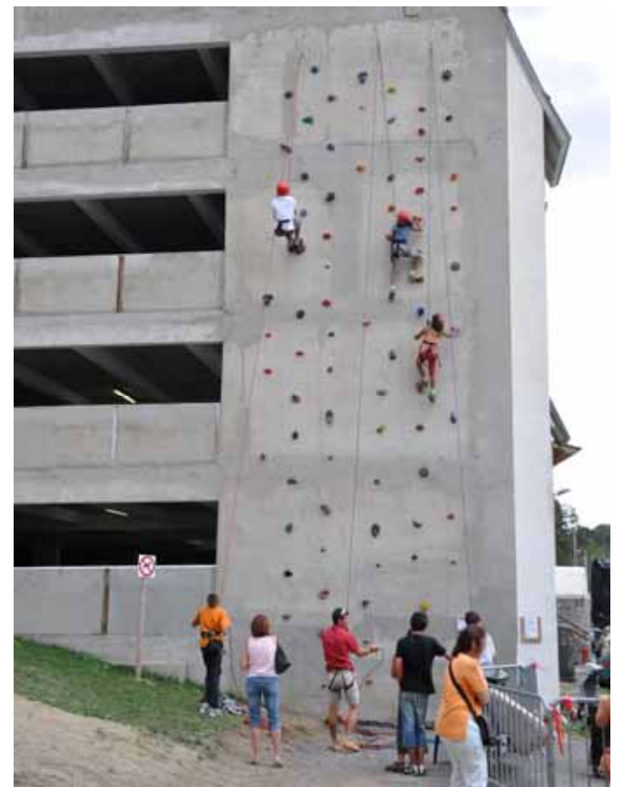
Mur d'escalade installé sur un mur du parking Borell