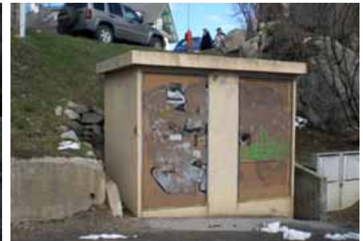
Souvenez-vous de l'agressivité visuelle des transformateurs