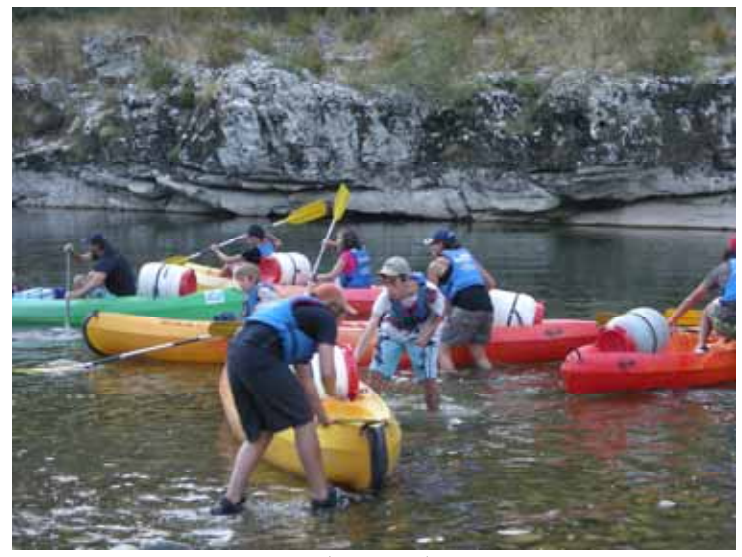
Mini-séjour Vallon Pont D'arc (l'Ardèche)