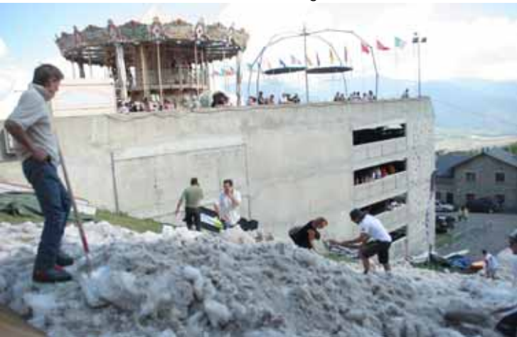
Les bénévoles préparent la piste de neige du ski m'aime en août

L'accueil de sportifs en stage est désormais organisé. Nous avons ainsi accueilli les équipes britanniques de fond, demi-fond et de pentathlon, et au mois d'août, le club de volley de Narbonne. Le développement de ce type de stages, grâce à nos installations sportives, est à l'étude, et c'est pourquoi nous réfléchissons à transformer une partie de l'ESCB en véritable centre de préparation physique moderne, muni de tous les équipements de récupération nécessaires. Ce programme devra bien sûr s'inscrire rapidement, en vue de la préparation des jeux de Londres en 2012, et ces nouvelles infrastructures seront également accessibles à