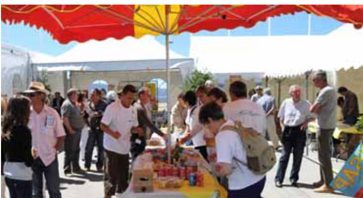
Les bénévoles organisant un des apéritif

Une première journée riche en événements, ouverte