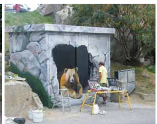
L'artiste en action a dévoilé tout son talent au profit de réelles œuvres d'art!

Contact : Cathy LEMAIRE, 06 33 03 15 11 ou cathy.lemaire66@gmail.com