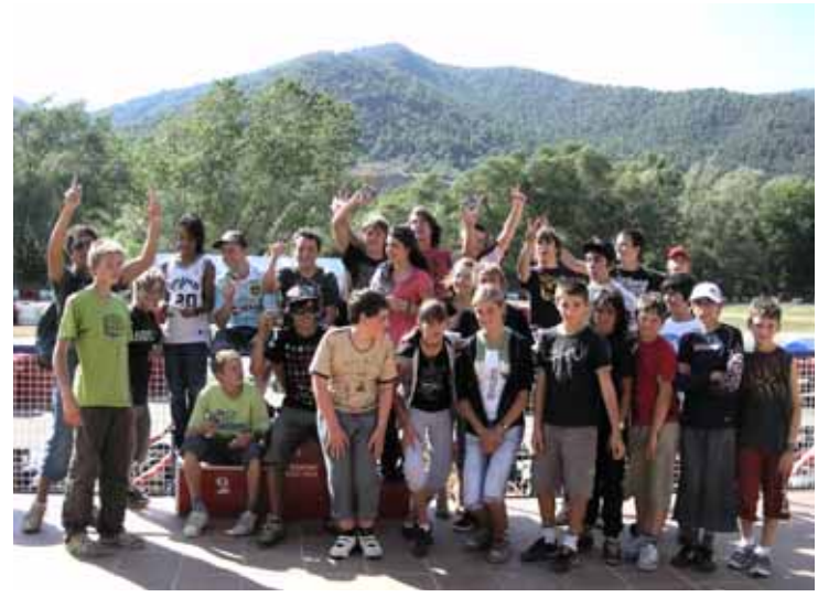
Karting à la Seu d'Urgell