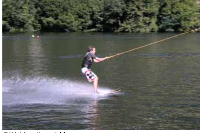
Téléskinautique à Mercus