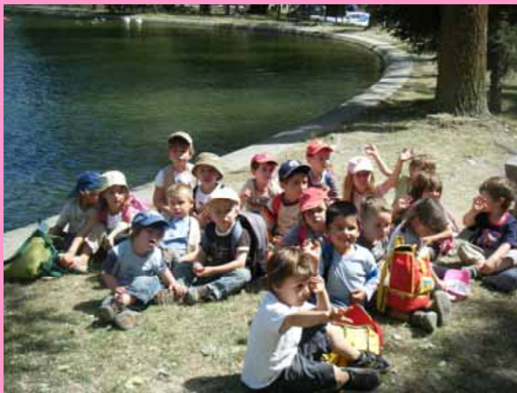
Sortie au lac d'Osséja