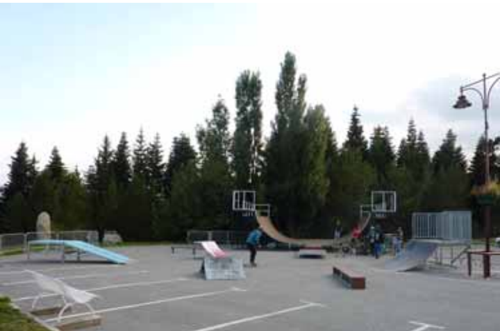
Skate park implanté sur le parking du Menhir

Pour les projets majeurs : le nouveau groupe scolaire et le projet cœur de station, on avance tous ensemble dans la concertation, la transparence, et avec le souci majeur de préserver le cadre naturel qui est notre exceptionnelle ressource ! Suivant cette logique, la loi relative à l'affichage dans le Parc Naturel Régional sera