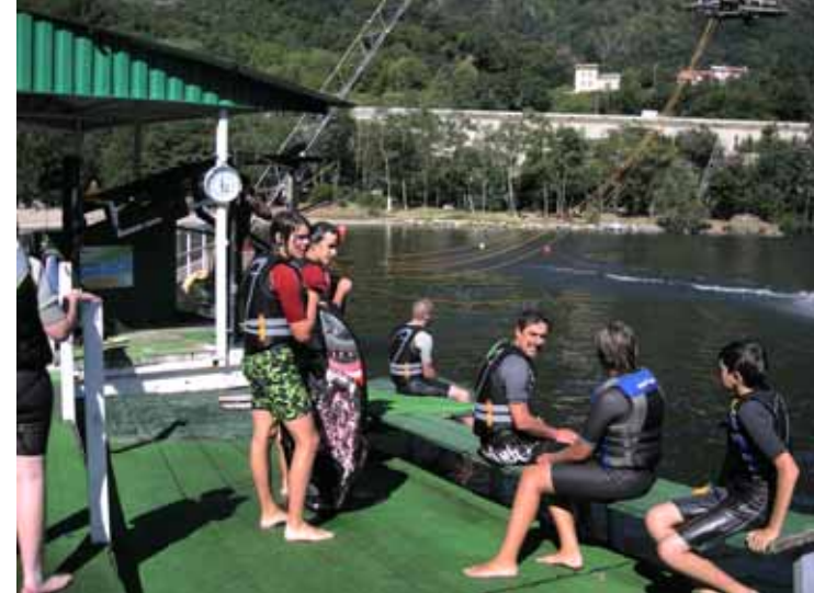
Téléskinautique à Mercus