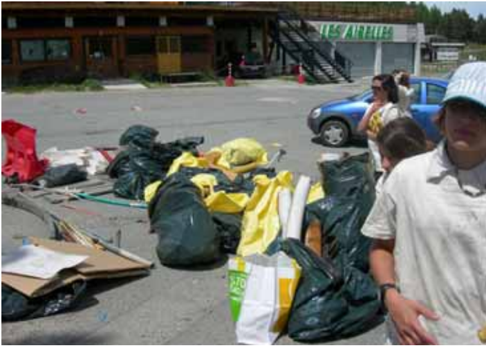
Le résultat d'1h30 de ramassage

Une journée de sensibilisation à l'environnement a été organisée en partenariat avec le collège Pierre de Coubertin de Font-Romeu. 47 élèves de 5 e et leurs accompagnateurs se sont divisés en 2 groupes afin de nettoyer les abords du parking des Airelles et de celui de la Calme. En 1h30 de ramassage, ce sont environ 6m 3 de déchets de toutes sortes (éléments de signalisation, vieux pneus, canettes et